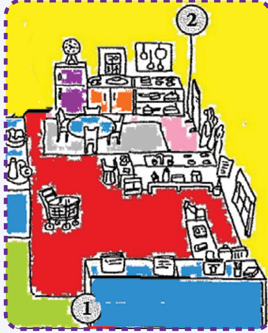
1. Giriş-Koridor/Blok Merkezi 2. Dramatik Oyun Merkezi

Bu ortamlarda dikkat edilmesi gereken nokta, öğrenme merkezlerinin birbirlerinden belirgin bir biçimde ayrılmış olmasıdır. Bunun amacı çocukların küçük gruplar hâlinde her bir öğrenme merkezinde daha etkin çalışabilmesini sağlamaktır. Öğrenme merkezleri birbirinden ayrılmış olsa da birbirinden kopuk ve bağımsız değildir. Çocuklar bir öğrenme merkezinde çalışırken diğerlerinde neler olup bittiğini kolayca takip edebilir. Bir öğrenme merkezinden diğerine erişim oldukça kolaydır. Öğrenme merkezleri birbirinden açık raf sistemine sahip, çocuk boyuna uygun dolaplarla ayrılmıştır. Dolapların çocuk boyuna uygun olması çocuğun çalışmak istediği materyale kendi başına ulaşması ve işini bitirince materyali yine kendi başına yerine kaldırması açısından önemlidir. Olası çarpma ve yaralanmaları önlemek için masa ve sandalyelerin kenarlarının sivri değil oval olmasına dikkat edilmelidir.